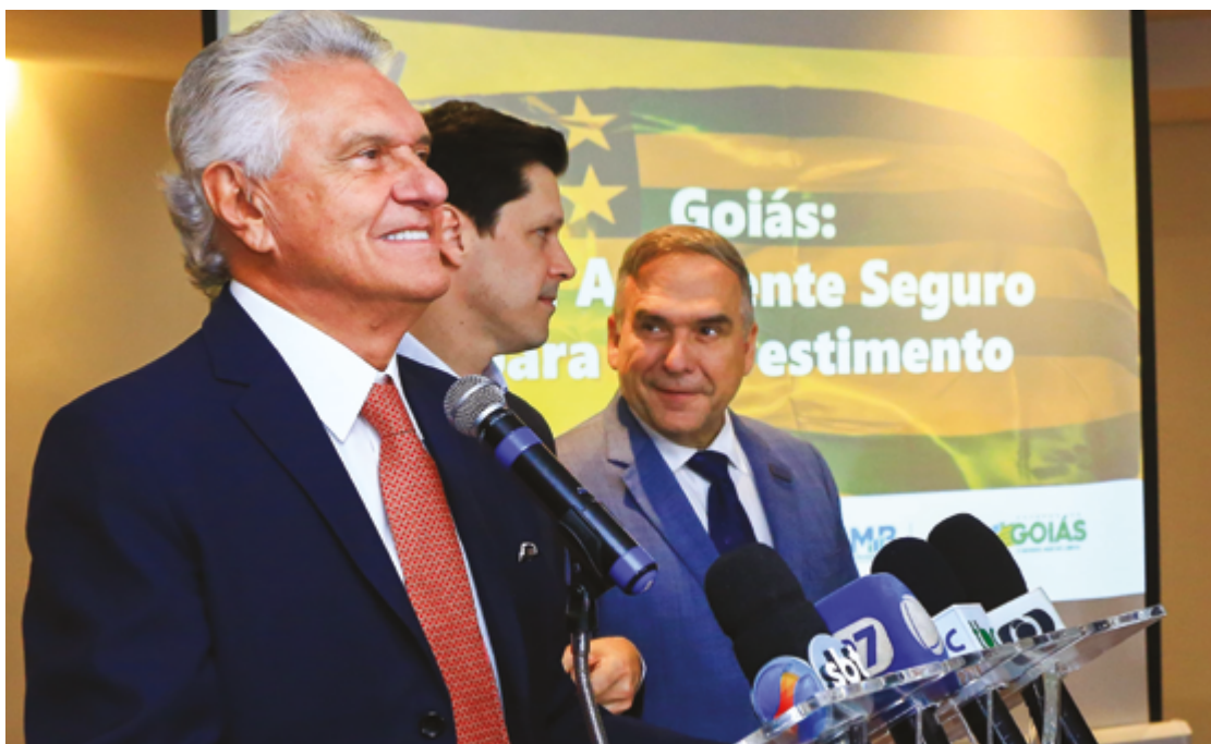
“Estamos colocando Goiás no patamar que ele merece”, disse Ronaldo Caiado no ato de divulgação das projeções econômicas do estado

“Estamos colocando Goiás no patamar que ele merece. Criamos uma mentalidade, uma conduta de atingir metas cada vez mais altas. Buscamos dar liberdade econômica ao estado, facilitar a vida do empresário, diminuir a burocracia e dar eficiência, atendendo aqueles que geram emprego”, afirmou Caiado. Ao comemorar o resultado, ele ainda reforçou que trabalha para que Goiás seja “não só um estado competitivo, mas com a melhor qualidade de vida para a população”.