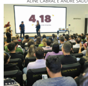
“Páscoa solidária”: OVG recebe doação de alimentos não perecíveis e leite longa vida

Nutriex e da Rennova, também agradeceu pela parceria e fez questão de enaltecer a gestão estadual em prol da iniciativa privada e de toda a população. “Agradecemos tudo que o governo está fazendo por Goiás. É uma honra ser goiano, ter nascido nesse Estado. Temos a certeza que nossos colaboradores, a Nutriex e a Rennova ainda se reunirão em muitas mais ações para fazer o bem.”