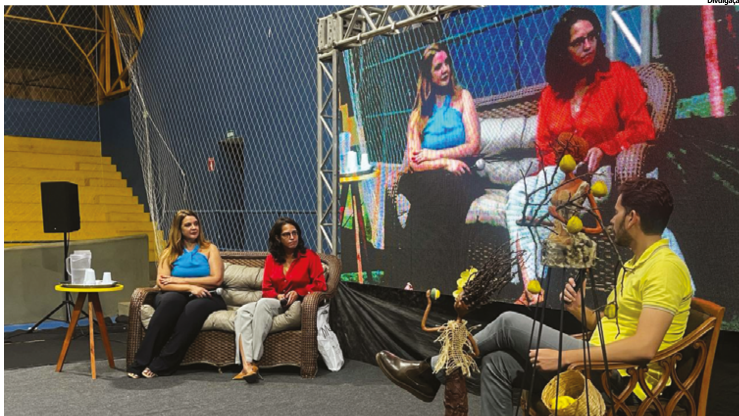
Evento reuniu mais de mil pessoas para participar de 16 palestras, além de lojistas e artesãos