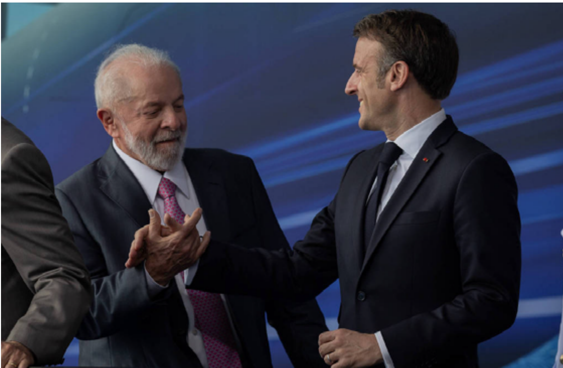
Lula da Silva e Emmanuel Macron: acordos e parcerias sobre meio ambiente e paz mundial

“O presidente Macron e eu concordamos em ampliar esse