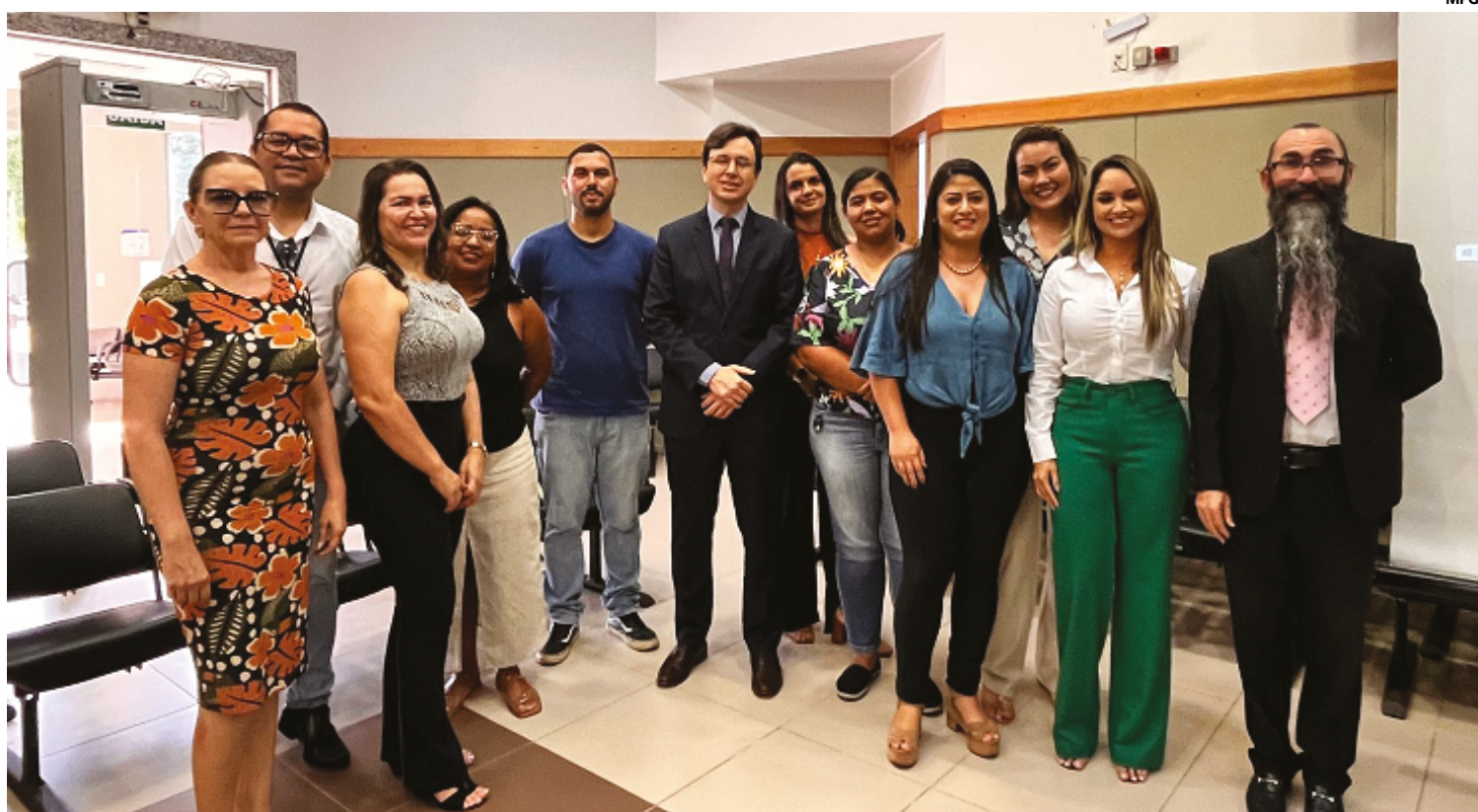
Na ocasião, destacou-se o fato de que o município apresenta um potencial de destinação de R$ 546.581,88 para esses fundos, tendo, no entanto, arrecadado apenas R$ 2.238,65 em 2023