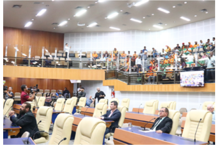
Plenário da Câmara Municipal de Goiânia

O Tribunal Regional Eleitoral de Goiás (TRE-GO) agendou nova totalização de votos em Goiânia para 5 de abril, às 9h30, "em decorrência de atualizações de registros de candidatura pendentes". A decisão ocorre após o Tribunal Superior Eleitoral (TSE) comunicar à secretaria judiciária do TRE, na última quinta (21), para "adoção das providências necessárias" de decisões da justiça eleitoral, que prevê o afastamento do mandato dos vereadores do PTC (atualmente Agir) e PMB na Câmara Municipal.