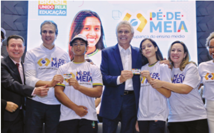
Ronaldo Caiado, Camilo Santana e demais autoridades no lançamento do programa Pé-de-Meia em Goiás: incentivo para conclusão do ensino médio