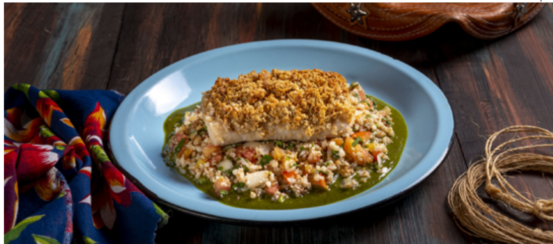
Piry, restaurante localizado no Jardim América: pintado crocante

No Setor Marista, o L'Étoile D'Argent traz menus com peixe para almoço e jantar durante sexta, sábado e domingo. O almoço inclui filé de tilápia grelhado com molho dijonnais e alcaparras, acompanhado de couscous marroquino e le-