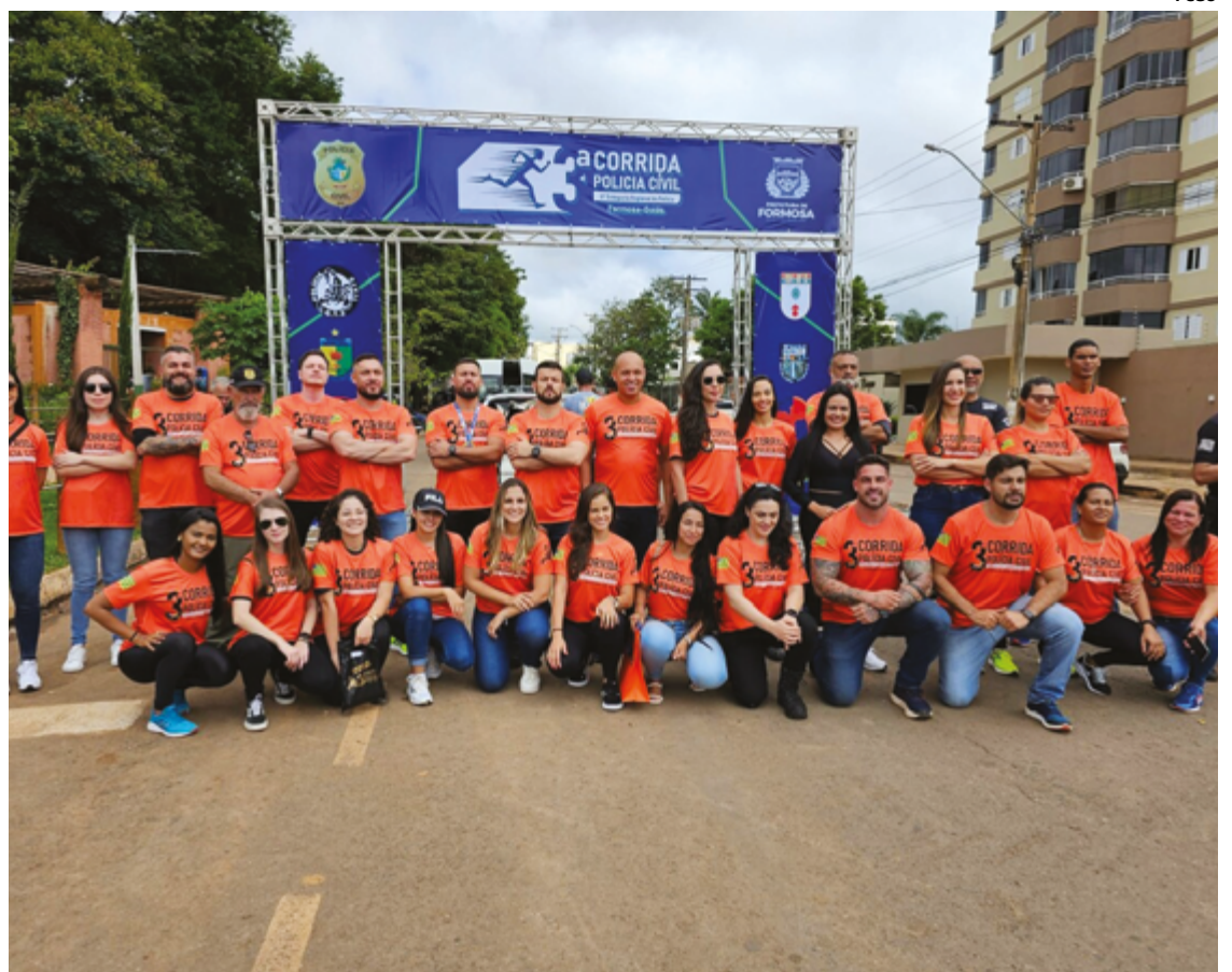
A adesão foi tão intensa que as inscrições se esgotaram rapidamente, demonstrando o grande interesse dos moradores de Formosa e região em participar do evento

Atividades esportivas como corridas de rua não apenas proporcionam benefícios físicos e mentais aos participantes, mas também estimulam a adoção de um estilo de vida ativo e equilibrado. O apoio de instituições públicas a eventos esportivos é essencial para promover uma comunidade mais saudável e engajada.