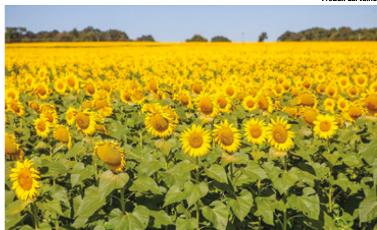
Agrodefesa alerta o produtor rural que o prazo para a semeadura do girassol em Goiás termina no próximo domingo (31/03)

A gerente informa ainda que a IN nº 01/2022 estabelece também a obrigatoriedade da destruição de toda e qualquer planta voluntária de soja nas imediações das lavouras de girassol, permitindo que apenas