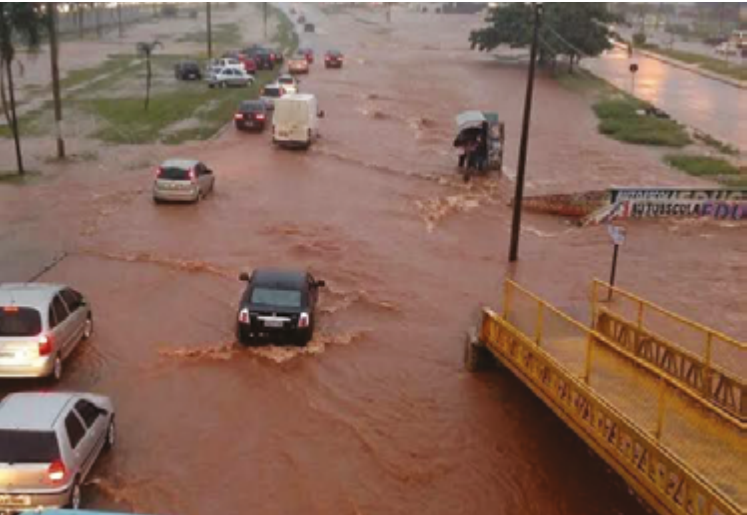
Alagamentos pela cidade têm sido uma realidade constante para a população