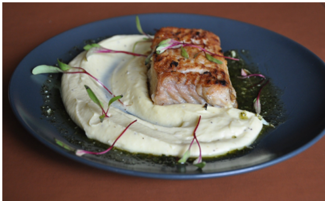
Biere du Parc, situado no Jardim Goiás: pirarucu ao purê de banana da terra e molho pesto